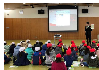
見学前の全体説明