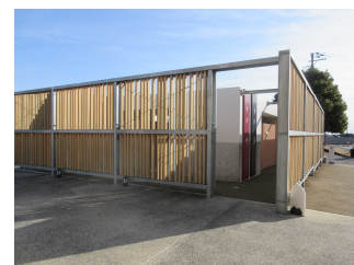
駐車場のトイレの外観