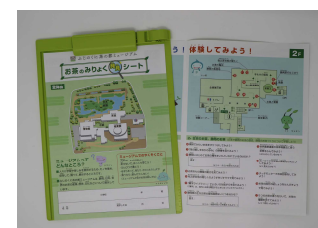
子ども向けワークシート